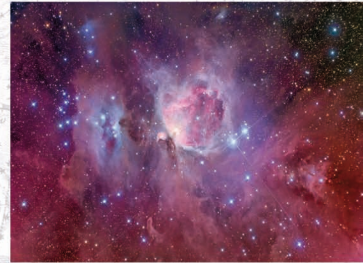
DER ORION-NEBEL, MESSIER 42